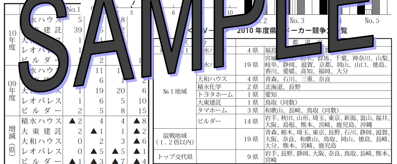
<表I-10> 大手注文系ビルダー棟数推移